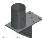
Base metálica Tipo 1